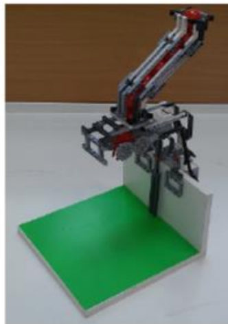
Рис. 2. Внешний вид устройства выдачи шариков

2.7. Шарик падает из устройства выдачи шариков в середину ячейки с высоты 200 мм в течении 0,5 с после нажатия кнопки.